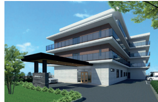
BIMによるパースイメージ