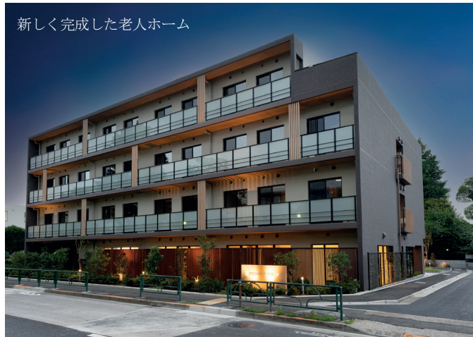
新しく完成した老人ホーム

このアプローチは、建設業をデジタル時代に移行させる最新技術によって、効率的で安全、かつ高品質の建設を提供し、良きパートナーになるという平岩建設の幅広い使命の一部となっている。