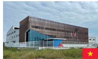
在越南新建的工廠

技術所提供的安全性而自豪。Hiraiwa成立於1946年，早在競爭對手之前就意識到該行業對維修工作的需求，在大約20年前，該公司就建立了專註於環保方法的翻新部門。這些翻新工作包括對Hiraiwa定製的抗震解決方案進行改造，幫助其客戶遵循日本嚴格的抗震法規。正如總裁Toshikazu Hiraiwa所解釋的那樣，公司的工作不僅僅是簡單